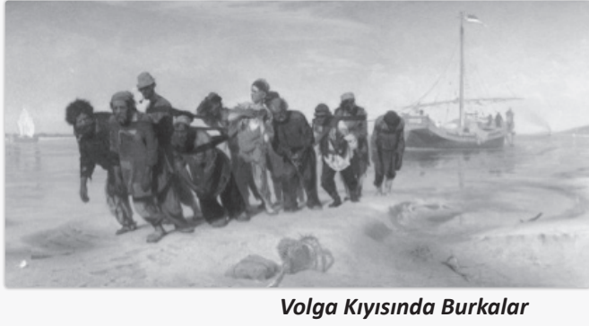
Volga Kıyısında Burkalar

beni olağanüstü etkiliyor ve huzursuz kılıyor, adeta kendiliğinden tuvale akıyor. Gerçeklik öylesine acımasız ki, oturup nakış motifleriyle vakit geçirmeye vicdanım elvermez -en iyisi bu işi iyi yetiştirmiş soylu hanımefendilere bırakalım." (İ. Repin)