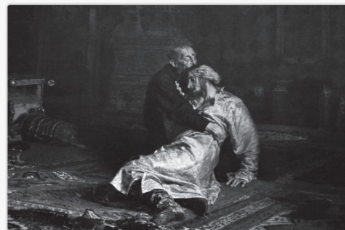
Korkunç İvan ve Oğlunu Öldürüyor

Öyle ki bu eserlerinin en bilinenlerinden olan Korkunç İvan ve Oğlunu Öldürüyor isimli eseri, sergilendiği müzede, iktidar yanlısı Ruslar tarafından bugün hala saldırıya uğramaktadır. Bu eser sanatçının, olay ile ilgili psikolojik durumu son derece başarılı yansıması açısından öne çıkmaktadır. Tiyatro metinlerine de konu olan olayda 4. Rus Çarı İvan Vasilyeviç (Korkunç İvan) hamile gelini ni döver ve yanına gelen oğlunu da bir asa darbesi ile öldürür. Repin bu gerilimli durumu gerçekçi bir şekilde yansıtabilme için İvan'ın gözlerini çizerken mezbahada öldürülen hayvanların gözlerinden esinlenmiştir.