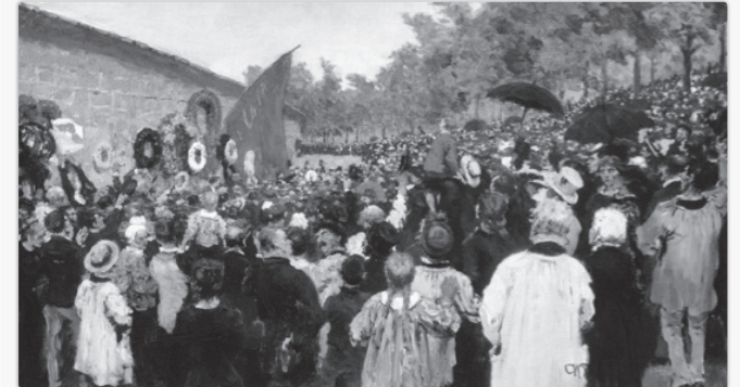
Père Lachaise Mezarlığı'nda Komünler Duvarı Yakınındaki Yıllık Anması

dursa da Bolşevikler onu Rus Gerçekçiliğinin önemli bir ismi olarak görmüştür. Devrimden sonra Sovyet İktidarı bir heyet göndererek Repin'i SSCB'ye davet etmiştir. Repin bu davete yanıt vermese de Sovyet iktidarı onu kültür-sanat çalışmalarını gündeminden hiçbir zaman geri tutmamış, genç sanatçılara örnek olarak göstermiştir. 1924 yılında 80. doğum günü vesilesi ile onuruna Moskova ve Petersburg'da sergiler düzenlenmiştir.